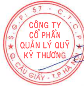
Ông PHÍ TUẤN THÀNH