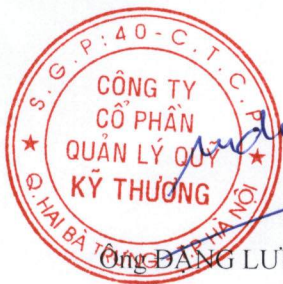
Ông ĐẶNG LƯU DŨNG