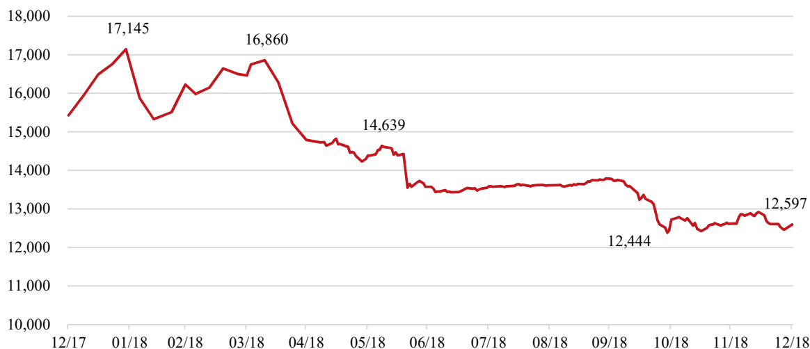
Giá trị Tài sản ròng trên CCQ (đồng)

Tại 31/12/2018, Giá trị Tài sản ròng trên chứng chỉ quỹ (NAV/CCQ) đạt 12.597 đồng, giảm 18,4% so với mức cuối năm 2017. Mức giảm này chủ yếu do chiến lược của Quỹ tập trung vào các cổ phiếu đầu ngành, vốn hóa lớn. Mặc dù hoạt động của các doanh nghiệp vẫn tăng trưởng ổn định nhưng những cổ phiếu này bị ảnh hưởng nhiều bởi làn sóng rút vốn của khối ngoại ra khỏi các thị trường mới nổi khi tình hình kinh tế thế giới có nhiều bất ổn.